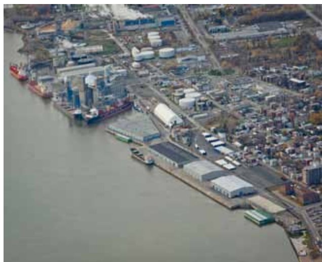
Port de Trois-Rivières.

L'objectif de la recherche consiste à développer une mesure et une évaluation de la performance des contrats de location des utilisateurs portuaires. Il s'agira de développer un indicateur de performance sur la base de facteurs clefs des opérations portuaires et de la relation entre la superficie et la tarification. Nous développons cet indicateur de performance en fonction d'une base de données sur les administrations portuaires du Canada. Les données seront compilées pour les activités de conteneurs, de vrac sec et de vrac liquide. L'étude comparative entre les ports permettra d'évaluer l'efficacité de l'utilisation des espaces portuaires. Les résultats devraient assister les administrations portuaires dans l'organisation de leurs espaces, l'identification des activités génératrices de revenus et l'établissement de critères de performance de location.