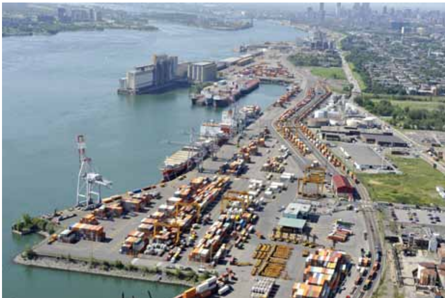
Port de Montréal.

Si le développement de nouveaux sites représente un prolongement du rôle de l'administration portuaire, il n'en est pas de même pour la réallocation d'espaces abandonnés ou sous-utilisés qui requièrent une réévaluation attentive. Les développements technologiques et les changements dans les types de marchandises manutentionnées ont entraîné l'obsolescence de plusieurs sites. Partout, la gestion de ces espaces tourmente les administrations portuaires.