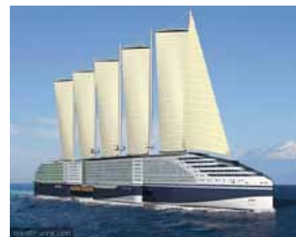
Le concept de paquebot vert Eoseas