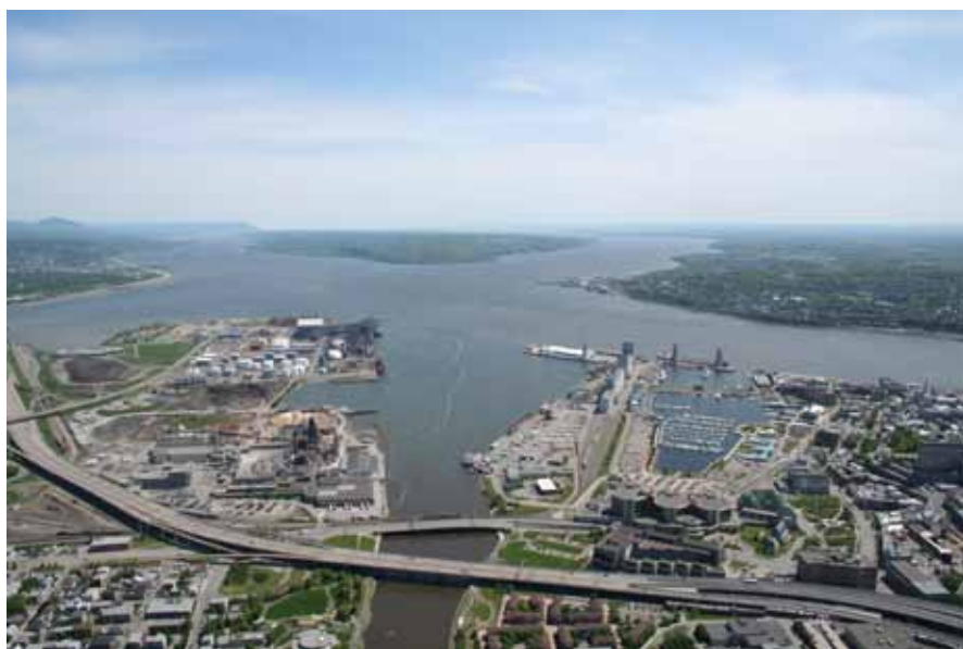
Port de Québec.

Durant la dernière décennie, les ports du monde ont été affectés par d'importantes réformes institutionnelles et organisationnelles essentiellement par l'adoption de politiques publiques de privatisation, de déréglementation et de décentralisation des infrastructures de transport. Ces réformes dans la gouvernance portuaire furent associées aux objectifs plus généraux d'amélioration de l'efficacité portuaire et au désir de réduire l'intervention de l'État dans la planification et la gestion des infrastructures maritimes. Les administrations portuaires doivent opérer au sein d'un cadre économique affichant des objectifs financiers très strictes mesurés en termes d'extrants et de coûts. Cet agenda force les administrations portuaires à optimiser l'allocation des