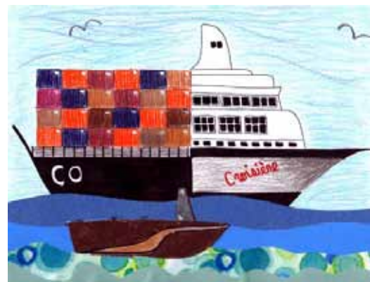
Dessin : Mary-Lou Beaudry

L'éducation et la promotion du secteur maritime auprès des plus jeunes permettra, à plus ou moins long terme, de s'inscrire de façon positive dans l'imaginaire québécois.