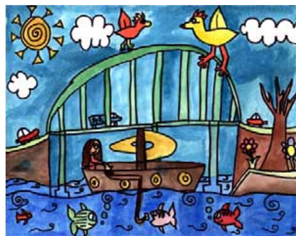
Dessin : Éliza Delisle

La Sodes est fière de collaborer à ce projet et croit que l'industrie maritime tire profit de ce partenariat.