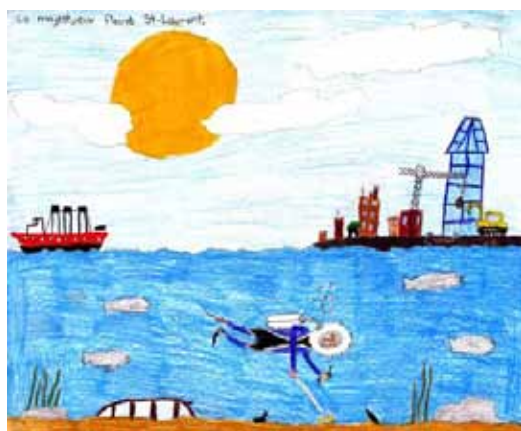
Dessin : Maxime Gélinas

Les élèves des niveaux primaire, secondaire et collégial de toute la province sont invités à participer au concours de dessins Mon fleuve et moi , organisé par la Fondation Monique-Fitz-Back. Le concours fera au total 50 finalistes, dont 10 lauréats, qui se mériteront de très beaux prix ! Date limite pour participer : 14 février 2014. Pour le guide de participation et les détails sur les prix suivez ce lien .