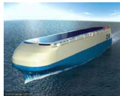
Concept de roulier vert

Le navire de l'avenir sera certes une nouvelle aventure technique, mais il devra aussi prendre en compte le rôle de l'équipage. L'humain demeurera plus que jamais essentiel au bon fonctionnement de ces géants. L'enseignement et la formation resteront donc la clé pour faire naviguer ces navires toujours plus complexes.