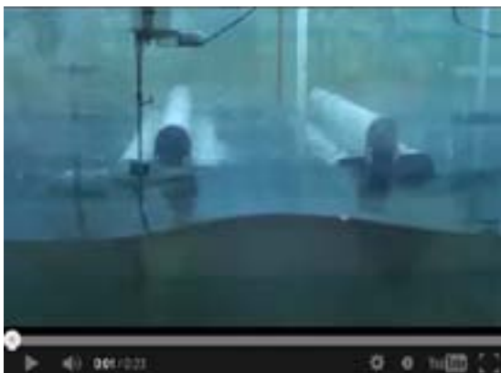
Brise-lames Narval en assemblage double, testés en bassin à houles à l'Université Laval

Cliquez pour visionner et en apprendre davantage: