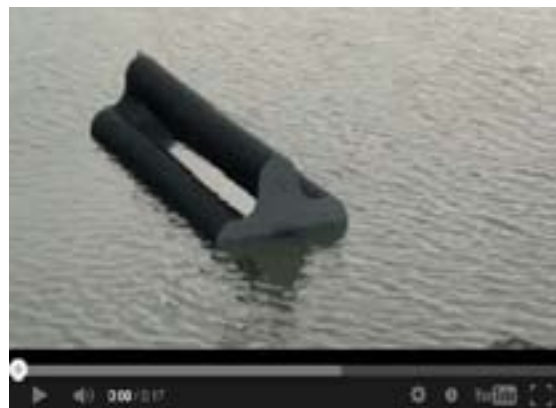
Échelle réelle du brise-lame Narval à Berthier-sur-Mer