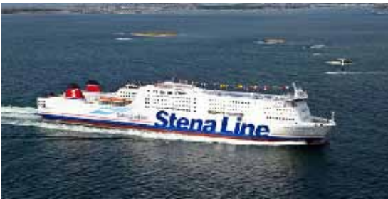
Le Stena Germanica de Stena Line

Le Stena Germanica de Stena Line, le premier traversier du monde à avoir été converti au méthanol, est de retour en service depuis le 26 mars dernier entre Kiel, en Allemagne, et Göteborg, en Suède. La conversion au méthanol de ce traversier a duré environ 6 semaines et a été effectuée en cale sèche au chantier Remontowa de Gdansk, en Pologne, et a coûté environ 22 millions d'euros, financés en partie par le programme de l'Union européenne « Autoroutes de la mer. »